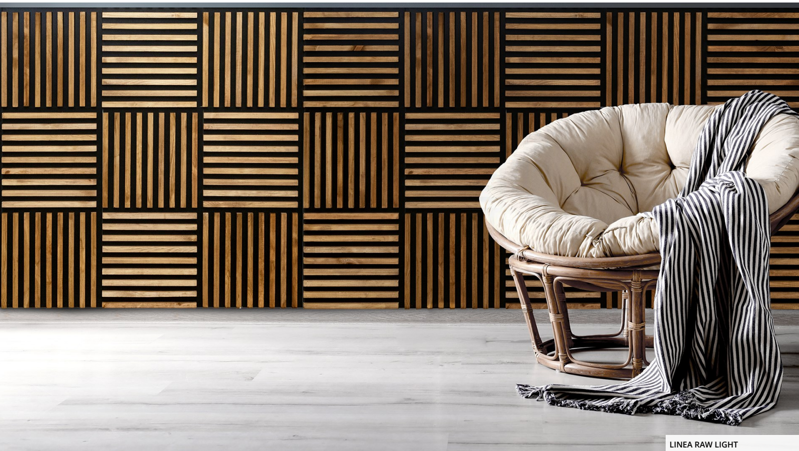
LINEA RAW LIGHT