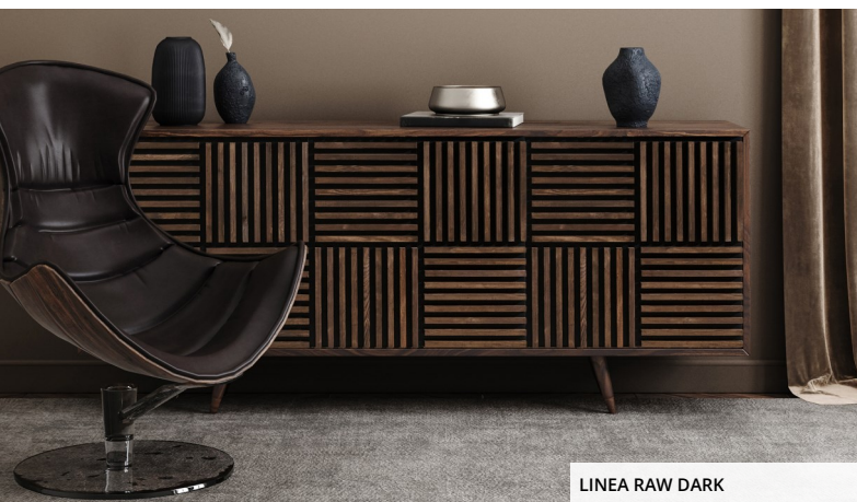
LINEA RAW DARK